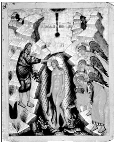
Крещение Господне. Новгород. XV в.

Святитель Макарий совершил великий труд по собиранию и систематизации текстов Житий святых, святоотеческих творений и духовного чтения. Труд этот завершился созданием Четы-Миней, ставших любимым чтением русского народа.