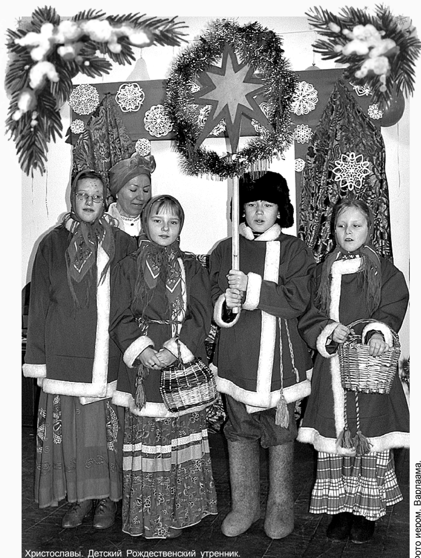
Христославы. Детский Рождественский утренник.

По благословию Преосвященного Епископа Архангельского и Холмогорского Тихона газета издается с марта 2000 г. * * * № 12 (79) Декабрь 2004 г.