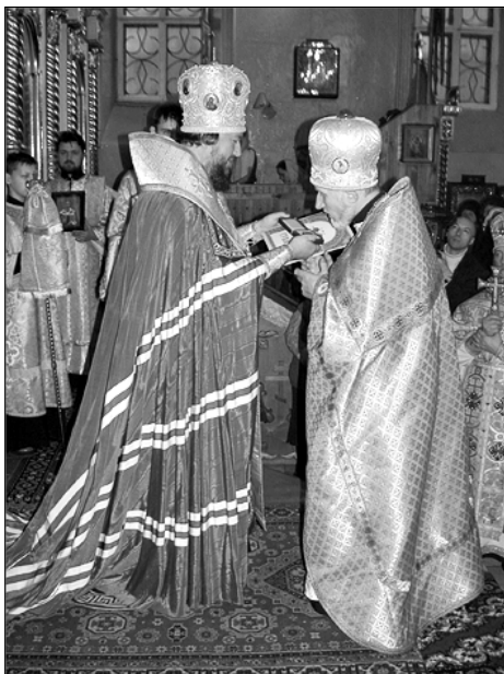
Фото иерод. Феофила